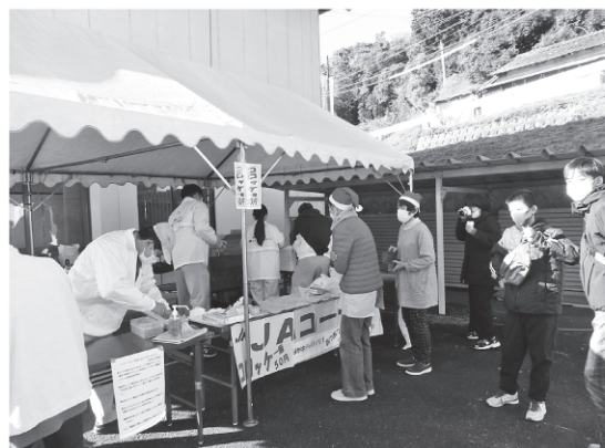
地区ふれあい委員会活動の風景