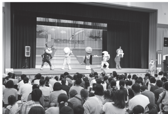
JA共済アンパンマン交通安全キャラバン風景