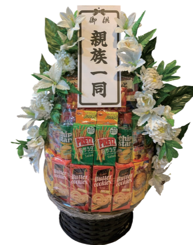
菓子一基 ¥11,000 (税込)