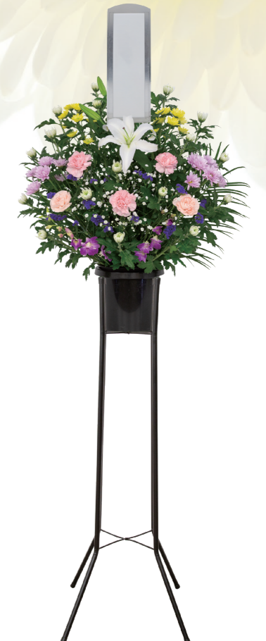
1基 ¥11,000 (税込)