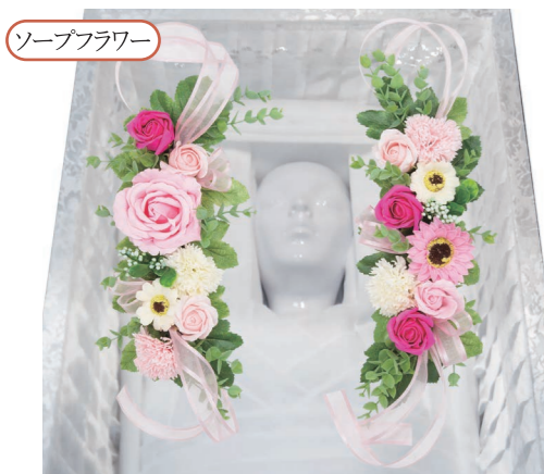
ピンク ¥7,700 (税込)