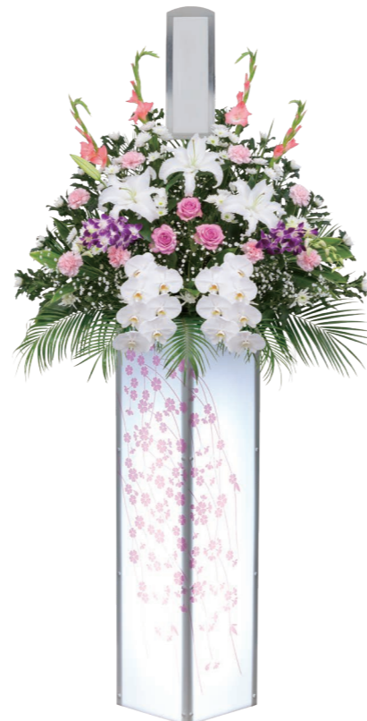
1基 ¥27,500 (税込)