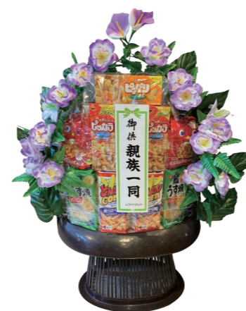
菓子一基 ¥6,600 (税込)