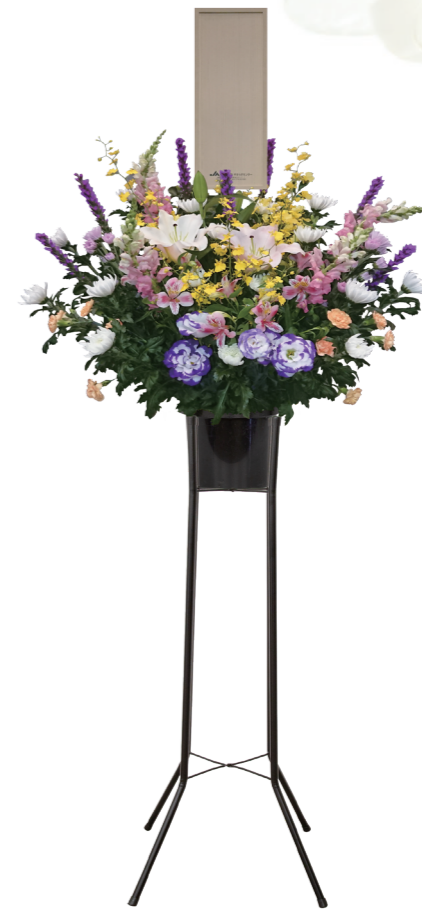
1基 ¥16,500 (税込)