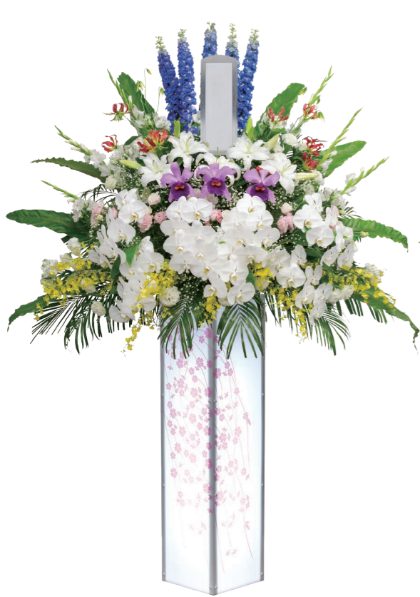
1基 ¥82,500 (税込)