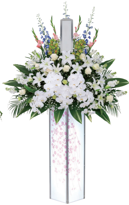
1基 ¥55,000 (税込)