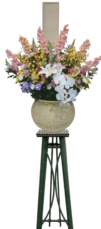
1基 ¥22,000 (税込)