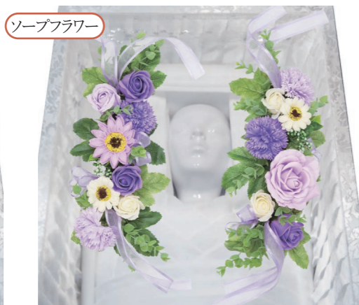
パープル ¥7,700 (税込)