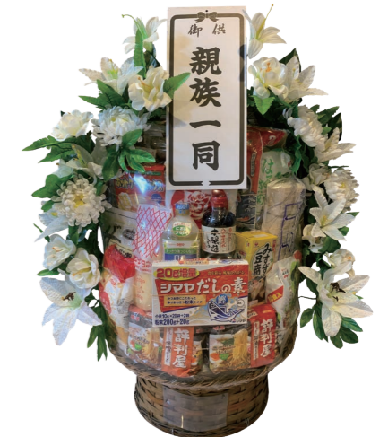
乾物一基 ¥11,000 (税込)